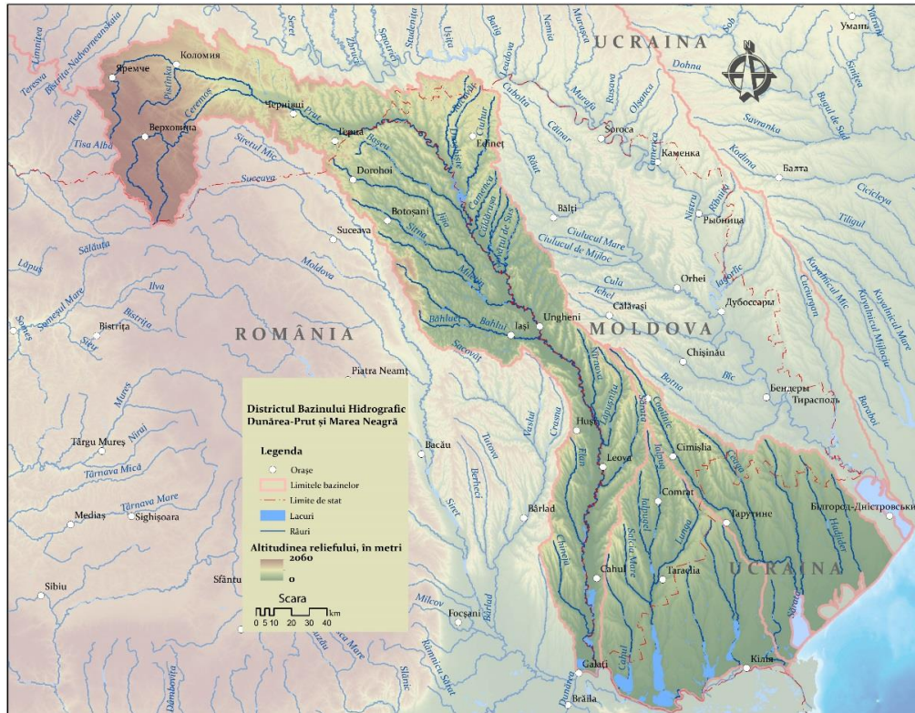
Bazinul Dunărea-Prut și Marea Neagră pe teritoriul Ucrainei, României și Republicii Moldova