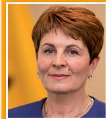
Валентина Цапиш, Государственный секретарь по вопросам окружающей среды, М.С.Х.Р.Р.О.С.

Реализация закона положительно скажется на окружающей среде, ее компонентах и экосистемах, учитывая тот факт, что закон, в первую очередь, предназначен для принятия необходимых мер для защиты окружающей среды и здоровья населения, путем предотвращения или уменьшения неблагоприятных последствий производства и управления отходами, включая опасные. В то же время осуществление закона будет способствовать выполнению международных обязательств, принятых Республикой Молдова после ратификации международных договоров по охране окружающей среды, которые будут полезны для долгосрочного развития на национальном, региональном и международном уровнях.