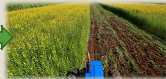
Înclinația pantei 5-8°, soluri puternic erodate