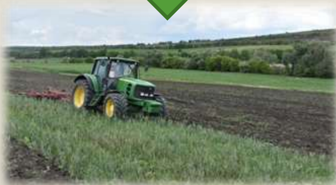
Înclinația pantei 3-5°, soluri slab erodate și moderat erodate

Includerea în asolament sau în rotația culturilor a ierburilor perene (ameliorative) și leguminoase