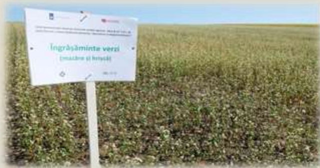
Înclinația pantei 1-3°, soluri neerodate și slab erodate